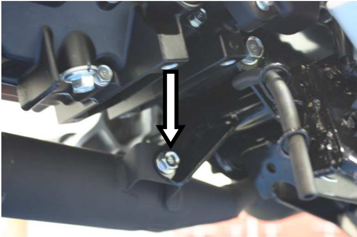
Svitare la vite di fissaggio collettore al telaio Unscrew the screw securing the collector to the frame