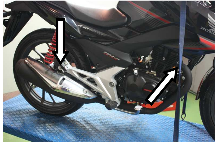
Svitare i dadi dai prigionieri del cilindro, la vite di fissaggio terminale e rimuovere il kit originale Unscrew the bolts securing the collector to the cylinders, the screw securing the silencer and remove the original kit