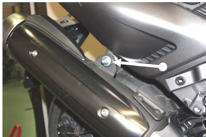
Svitare la vite indicata Unscrew the screw shown above