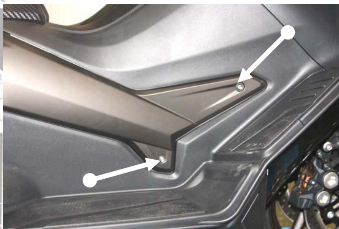
Svitare le viti indicate e rimuovere la carenatura Unscrews the screws shown above and remove the fairing