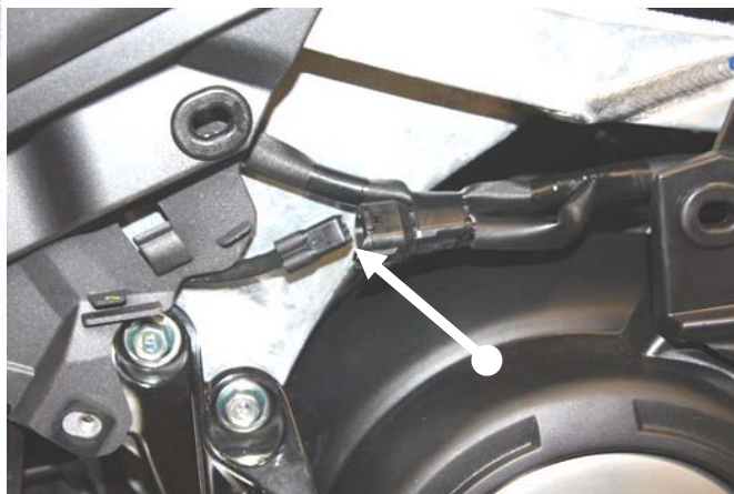
Disconnettere il cavo della sonda lambda Unplug oxygen sensor cable